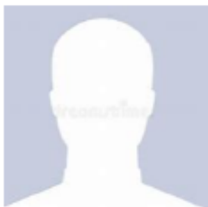
HANANE B BENABDELMOUMENE